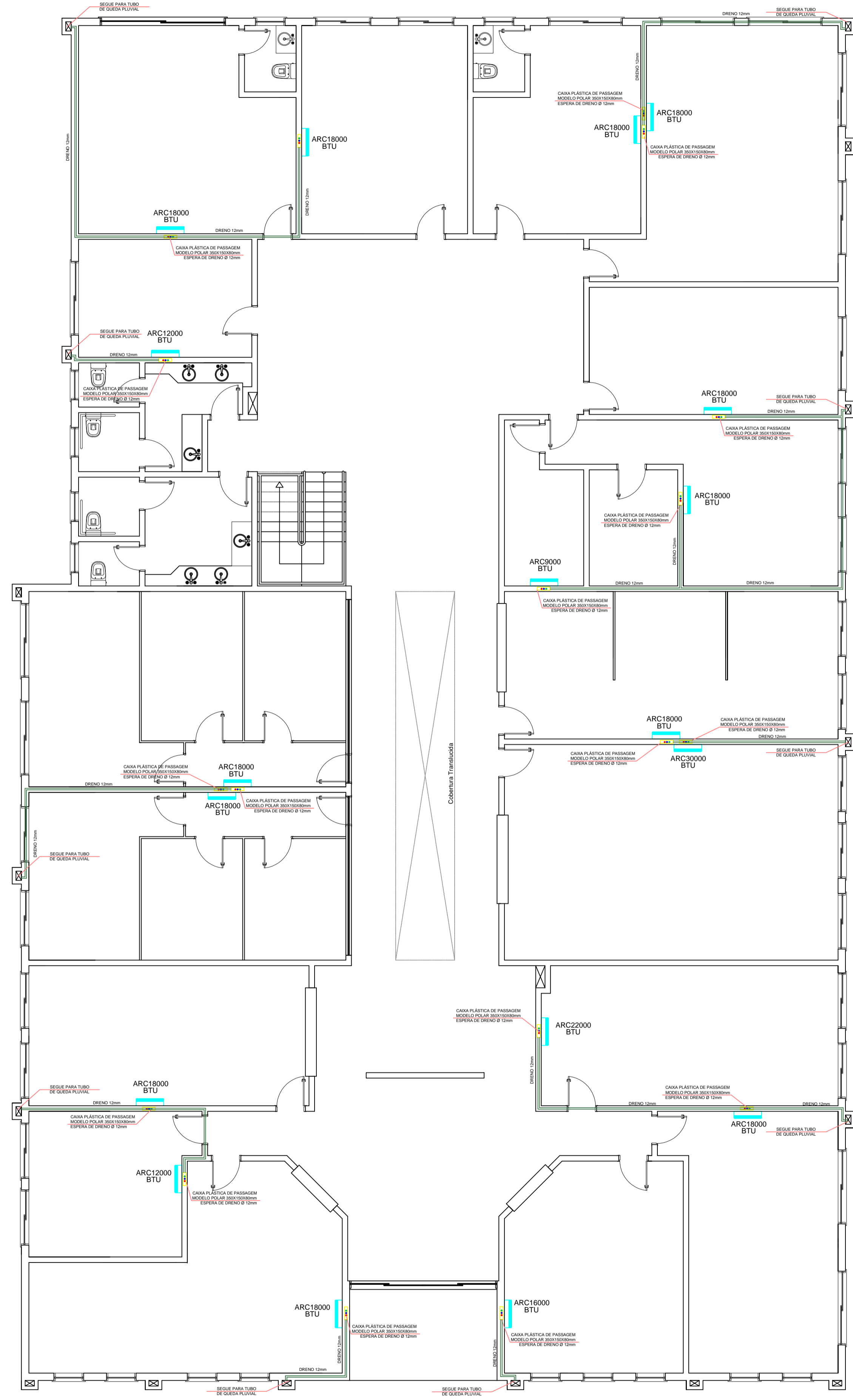
PROJETO CLIMATIZAÇÃO PAV. TÉRREO